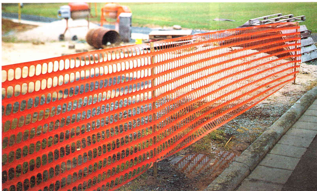
Art. Nr 7001 oraz Art. Nr 2159

Stosowane wszędzie tam, gdzie w ciągu kilku minut należy zabezpieczyć obszar niebezpieczny. Chroni równocześnie pracowników na budowie i przechodniów. Wykonane z materiału odpornego na promienie UV, przepuszczającego powietrze. Barierka zwijana w rolkę do wielokrotnego użytku.