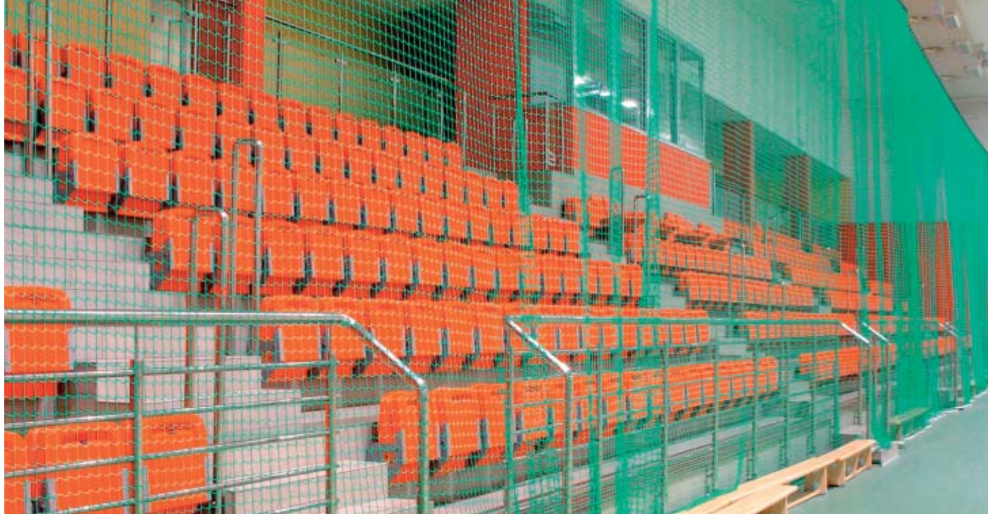
Hala Sportowo – Widowskowa w Trzciance