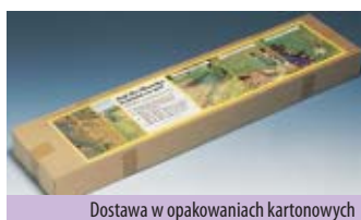
Dostawa w opakowaniach kartonowych

Długość ogrodzenia: 20 m Wysokość ogrodzenia: 80 cm Długość prętów: 1,10 m Rozstaw prętów: 1,80 m Ciężar całkowity: 3,3 kg Komplet z elementami mocującymi do podłoża i linkami napinającymi do zamocowania w narożnikach.