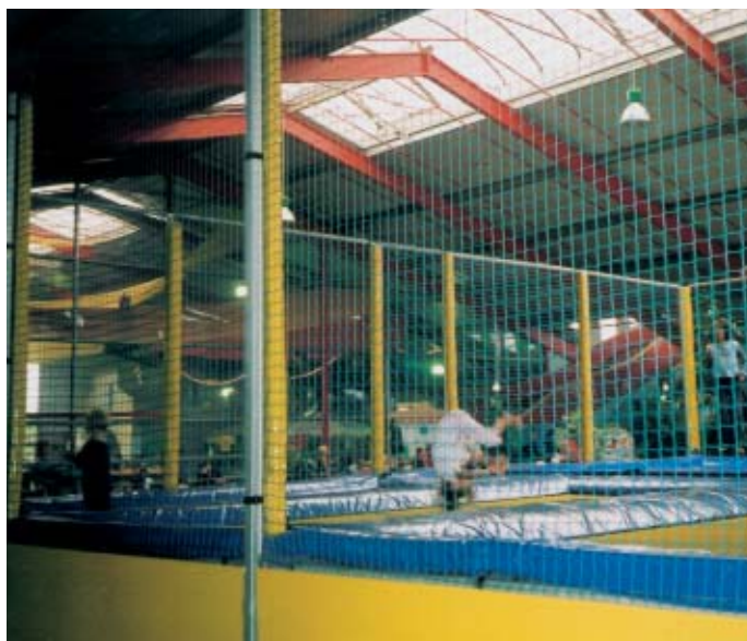
Nr 209-045-04 Siatka zabezpieczająca plac zabaw

Siatka uniemożliwiająca dzieciom wspinanie, ø 1,2 mm-1 mm.