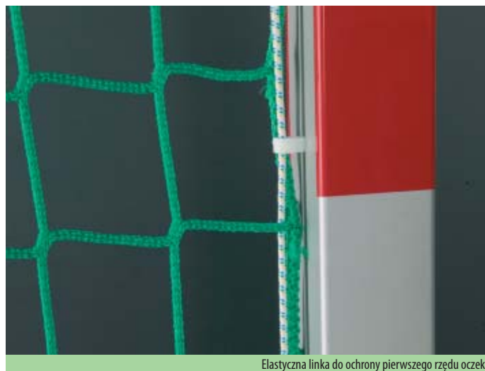
Elastyczna linka do ochrony pierwszego rzędu oczek