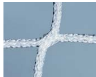
Poliester, bezwęzłowy, ø 4 mm, biały