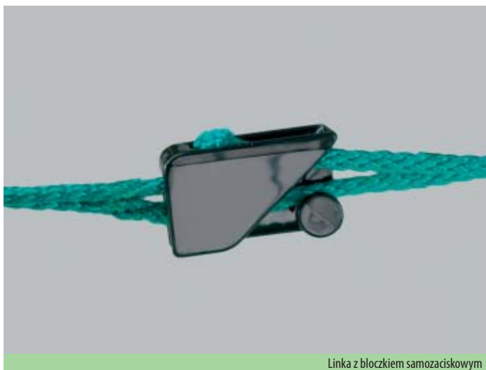
Linka z bloczkiem samozaciskowym