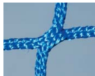
Polipropylen o wysokiej wytrzymałości, bezwęzłowy, ø 5 mm niebieski